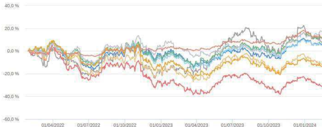
Retorno acumulado - 31/01/2022 até 16/02/2024 (diária)